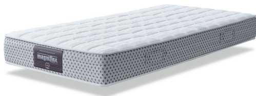
マニフレックス×ハイキュ ヴィロブロック VIROBLOCK マットレス (S) W100×D195×H21cm 165,000円 (税込) ~

ウイルスは、マスクや洋服などの繊維の表面では約2日間生き残ると言われている。当然、寝具でも同じだ。そこでマニフレックスでは寝具に、繊維製品イノベションの世界的リーダー、スイスのハイキュ社が開発した抗ウイルス加工「ハイキュヴィロブロック」を採用した。この最新テクノロジーは、インフルエンザやコロナなどのウイルスを吸着して破壊、わずか30分で99・99%減少させる効果があることがオーストラリアのピーター・ドハーティー研究所によって科学的に証明されている。感染症対策の専門家である館田教授も認める、「マニフレックス×ハイキュヴィロブロック」シリーズはマットレスの他、トッパーやシーツ、枕カバーもラインナップ。ウイルス対策としてぜひとも活用したい寝具だ。